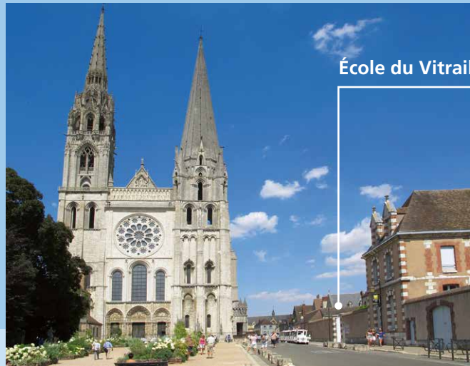
École du Vitrail et du Patrimoine

5, rue du Cardinal Pie 28000 CHARTRES (France) Tél: +33 (0) 2 37 21 65 72 contact@centre-vitrail.org